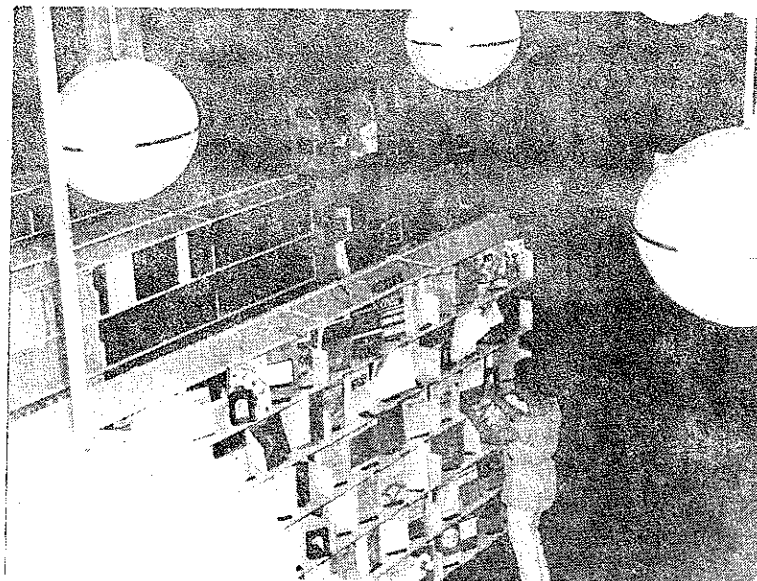
El edificio Gran Bretaña cuenta con instalaciones amplias y modernas y fue construido gracias al aporte financiero de la Overseas Development Administration (ODA) del Gobierno de Gran Bretaña.

oficinas para la dirección y secretaría; grandes áreas de colección y exhibición de publicaciones; cuenta con hermosos jardines interiores que ofrecen confort ambiental y luz natural; posee dos amplias salas de lectura y cubículos para estudio individual y en grupo.